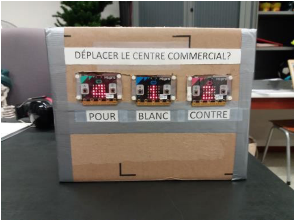
تصویر ۳. دستگاه شمارشگر رأی که نتایج جمع‌آوری شده را از صندوق‌های رأی نمایش می‌دهد و توسط کودکان استفاده شده است. (Clarival, 2021)

الکترونیک برای دانش‌آموزان، میزان استفاده از فناوری اطلاعات و ارتباطات در آموزش، میزان دسترسی مدارس کشور به اینترنت، میزان امکانات دیجیتال آموزش و پرورش) به دست آمده است.