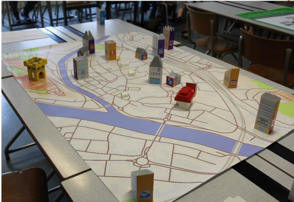
تصویر ۱ مدل شهر ساخته شده در طول طراحی کارگاه. (Clarinval,2021)